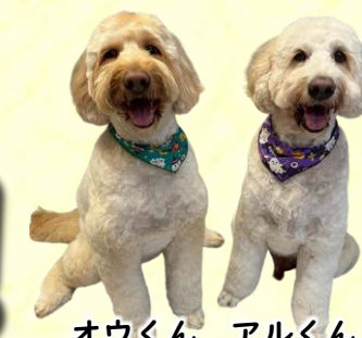
オウくん アルくん

みちのくファームは、埼玉県飯能市に本社を構える自社工場製造・無添加・厳選素材のフード専門メーカーです。「愛犬に本当に安全で、美味しいものを届けたい」という思いから、保存料・着色料を一切使わず、シンプルな製法にこだわっています。いつまでも長生きで元気でいてほしい愛犬のために、この度取り扱いを始めました。この機会にぜひ一度お試しください。