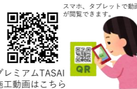
プレミアムTASAI 施工動画はこちら

※施工時間により大きく価格が左右される為、設計価格表の記載予定はないとの事ですのでご参考程度として下さい。