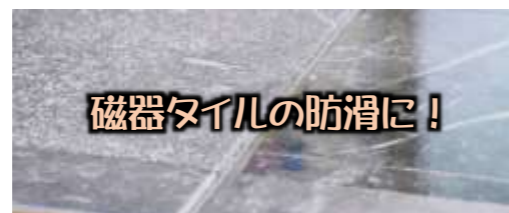
磁器タイルの防滑に！