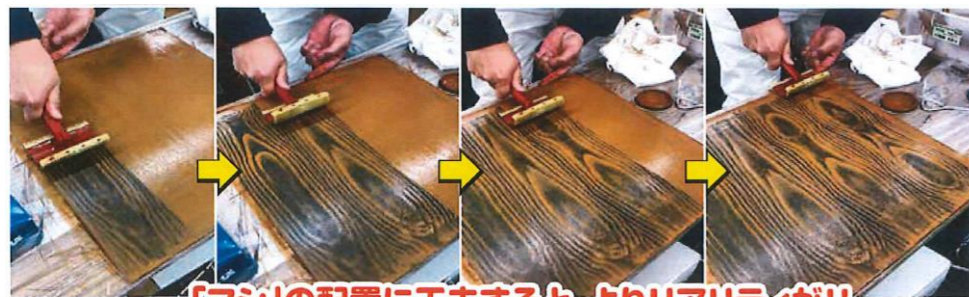
「フシ」の配置に工夫すると、よりリアリティが!!