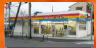
トハン足立営業所