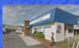
(株)トハン さいたま営業所