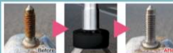
サビ取りブラシソケット