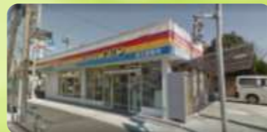
(株)トハン 足立営業所